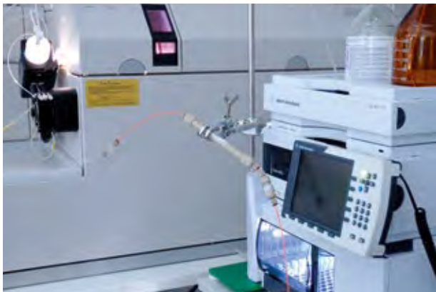
Kopplung der LC mit der ICP-MS zur Element-Spezies-Bestimmung

Sowohl die essentiellen als auch die toxischen Eigenschaften der Elemente hängen meistens von ihrer chemischen Bindungsform ab bzw. in welcher Spezies diese Elemente vorliegen. So haben z.B. sechswertige Chromverbindungen eine deutlich höhere Toxizität als die dreiwertigen Chrom-Spezies. Im Falle des Arsens sind die anorganischen Spezies eindeutig kanzerogen und stark toxisch verglichen mit dem viel weniger toxischen Arsenobetain. Gerade diese organisch gebundene Spezies kann jedoch nach Fischverzehr den Gesamt-Arsen-Gehalt im Urin signifikant erhöhen somit eine Intoxikation mit Arsen vortäuschen. In so einem Fall ist zur klinischen Diagnostik daher die quantitative Differenzierung der einzelnen Arsen-Spezies im Urin notwendig.